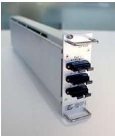
●光スイッチモジュール 結線方式を変更し、光ファイバの配線が容易になるように改良

「基本となるデバイスについては、心配していなかったのですが、上部のコントロールする部分は、さまざまな要求や仕様があり、苦労したところではないかと思えます。導入後にもディスカッションして、改善した件もありましたし、今でも、あらたな課題については、いろいろと相談し、問題解決にあたっていただいております。非常に感謝しております。」