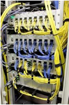
●光スイッチ装置「NSW-QAI」 最大256chの同時切り替えを実現

「最大のポート数は、256ポート程度を想定していましたが、都内に5か所、さらに名古屋、大阪という形で、既にサイト分散も進めており、中には、必ずしも最大数を必要としないサイトもありました。ある程度、光スイッチをモジュール化して、しかも拡張できるような仕組みというのがわれわれにとって必要でした。」